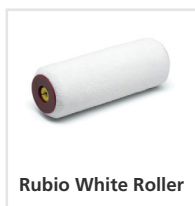
Rubio White Roller