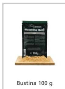
Bustina 100 g