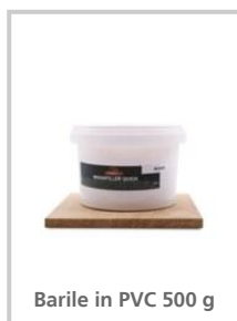
Barile in PVC 500 g