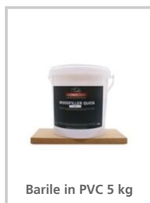
Barile in PVC 5 kg