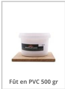
Fût en PVC 500 gr