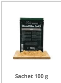
Sachet 100 g