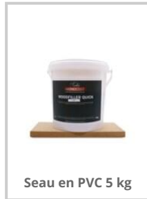
Seau en PVC 5 kg