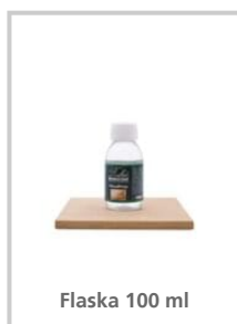
Flaska 100 ml