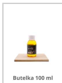
Butelka 100 ml