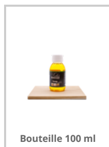
Bouteille 100 ml