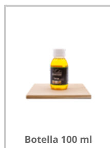
Botella 100 ml