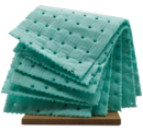
Rubio Monocoat Oil Removal Cloth