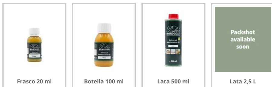
Frasco 20 ml