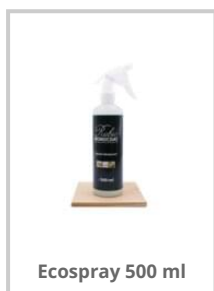
Ecospray 500 ml