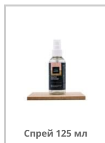
Спрей 125 мл