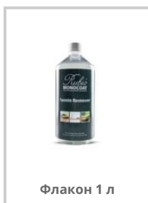
Флакон 1 л