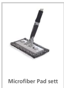
Microfiber Pad sett