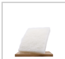
Rubio Monocoat Skurblock vit