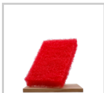
Rubio Monocoat Scrubby röd