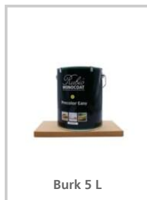
Burk 5 L