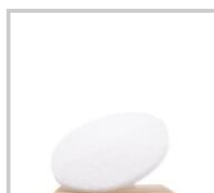
Rubio Monocoat Vit rondell 16 tum