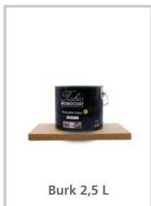
Burk 2,5 L