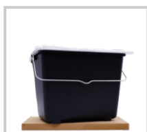
Rubio Monocoat Hink 7L