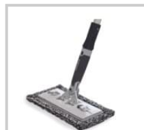
Rubio Monocoat Microfiber Pad Set