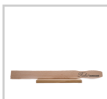
Rubio Monocoat Rörpinne