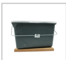
Rubio Monocoat Hink 12L