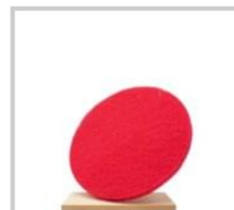
Rubio Monocoat Röd rondell 16 tum