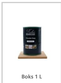
Boks 1 L