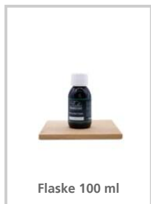
Flaske 100 ml