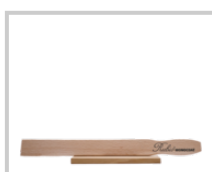
Rubio Monocoat Stirring Stick