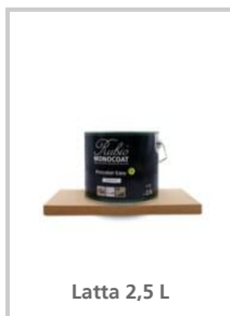
Latta 2,5 L