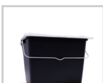
Rubio Monocoat Bucket 7L