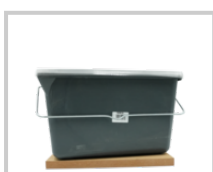
Rubio Monocoat Bucket 12L