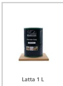
Latta 1 L