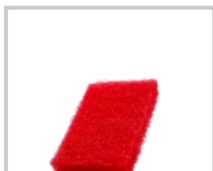
Rubio Monocoat Scrubby pad rosso