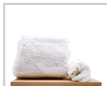
White Wiping Rag 1 kg