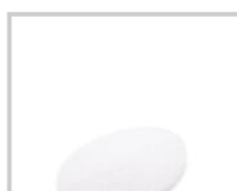
Rubio Monocoat Pad bianco 16 inch