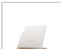
Rubio Monocoat Scrubby Bianco