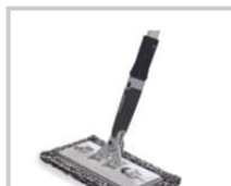
Rubio Monocoat Microfiber Pad Set