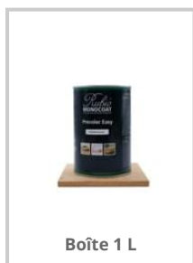
Boîte 1 L