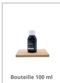
Bouteille 100 ml