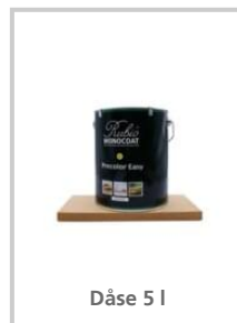
Dåse 5 l