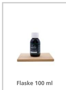
Flaske 100 ml