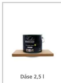
Dåse 2,5 l