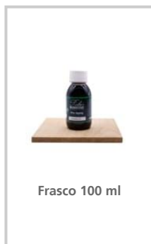
Frasco 100 ml