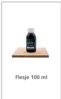
Flesje 100 ml