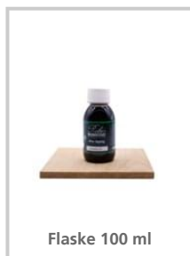
Flaske 100 ml