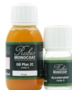
Set A+B Duo burk 130 ml