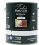
Set A+B Duo can 3,5 L