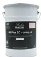
Burk 5 L