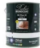
Set A+B Duo boks 3,5 L