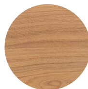
WHITE 5 PCT

Los colores son solamente un ejemplo. Recomendamos realizar una prueba sobre madera lijada idéntica.