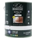
Set A+B Duo dåse 3,5 L