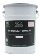
Dåse 5 l