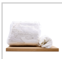
White Wiping Rag - set 1 kg