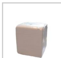
White Wiping Rag - set 10 kg