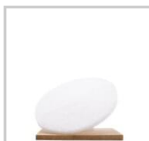
Rubio Monocoat Vit rondell 16 tum