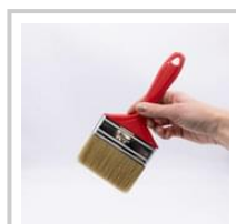
Rubio Monocoat Brush standard 100