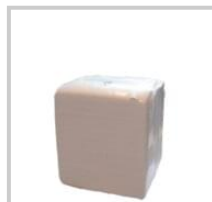
White Wiping Rag - set 10 kg