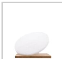
Rubio Monocoat White Pad 16 inch