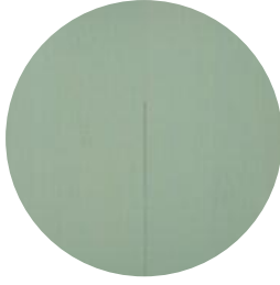
SALT LAKE GREEN