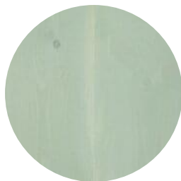
SALT LAKE GREEN