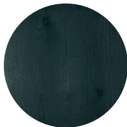
RUBIO MONOCOAT GREEN