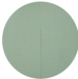
SALT LAKE GREEN