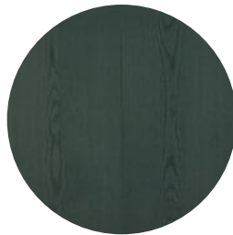
RUBIO MONOCOAT GREEN