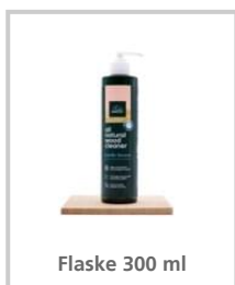
Flaske 300 ml