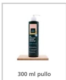
300 ml pullo