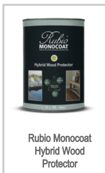
Rubio Monocoat Hybrid Wood Protector

Para más información, consulte el envase y la ficha de seguridad.