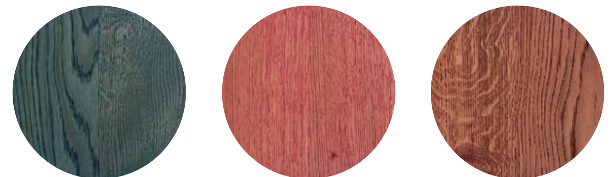
TEAL BLUE POMEGRANATE PINK RUSTY BROWN