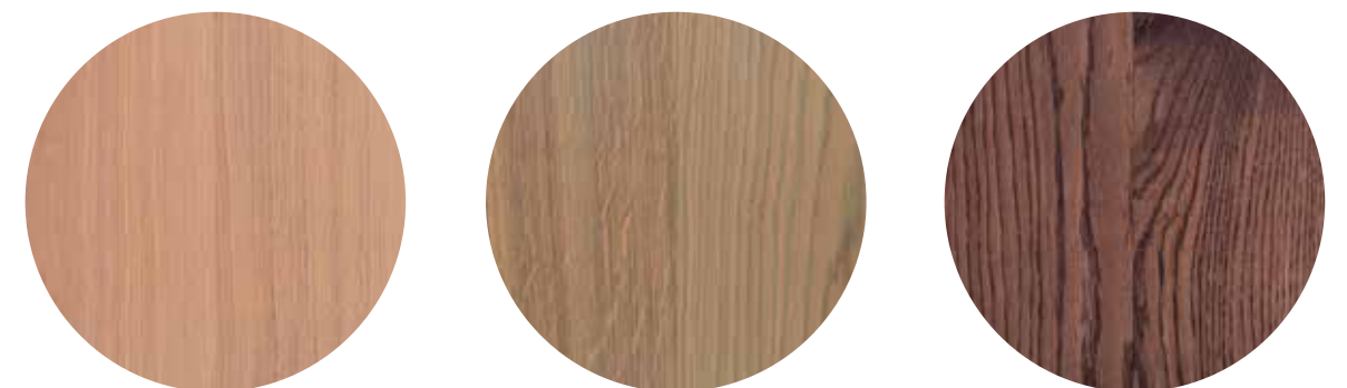
WINTER BLUSH FROST GREEN HEATHER PURPLE