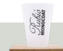
Measuring Cup 400 ml

Misurino per mescolare i prodotti (alcuni dei nostri prodotti devono essere miscelati con Accelerator o Softener)