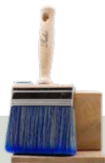
Block Brush 3x10

Perfetto per l'applicazione di WoodCream e WoodCream Softener • Garantisce un'applicazione uniforme • Molto resistente: acciaio inox di alta qualità • Perfetto per la lavorazione di prodotti a base d'acqua • Dopo l'uso con WoodCream, è possibile risciacquare semplicemente il pennello con acqua