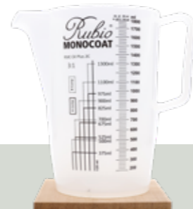
Measuring Cup 1800 ml

Misurino per mescolare i prodotti (alcuni dei nostri prodotti devono essere miscelati con Accelerator o Softener)