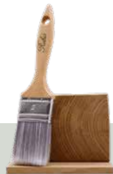
WoodCream Brush 2"