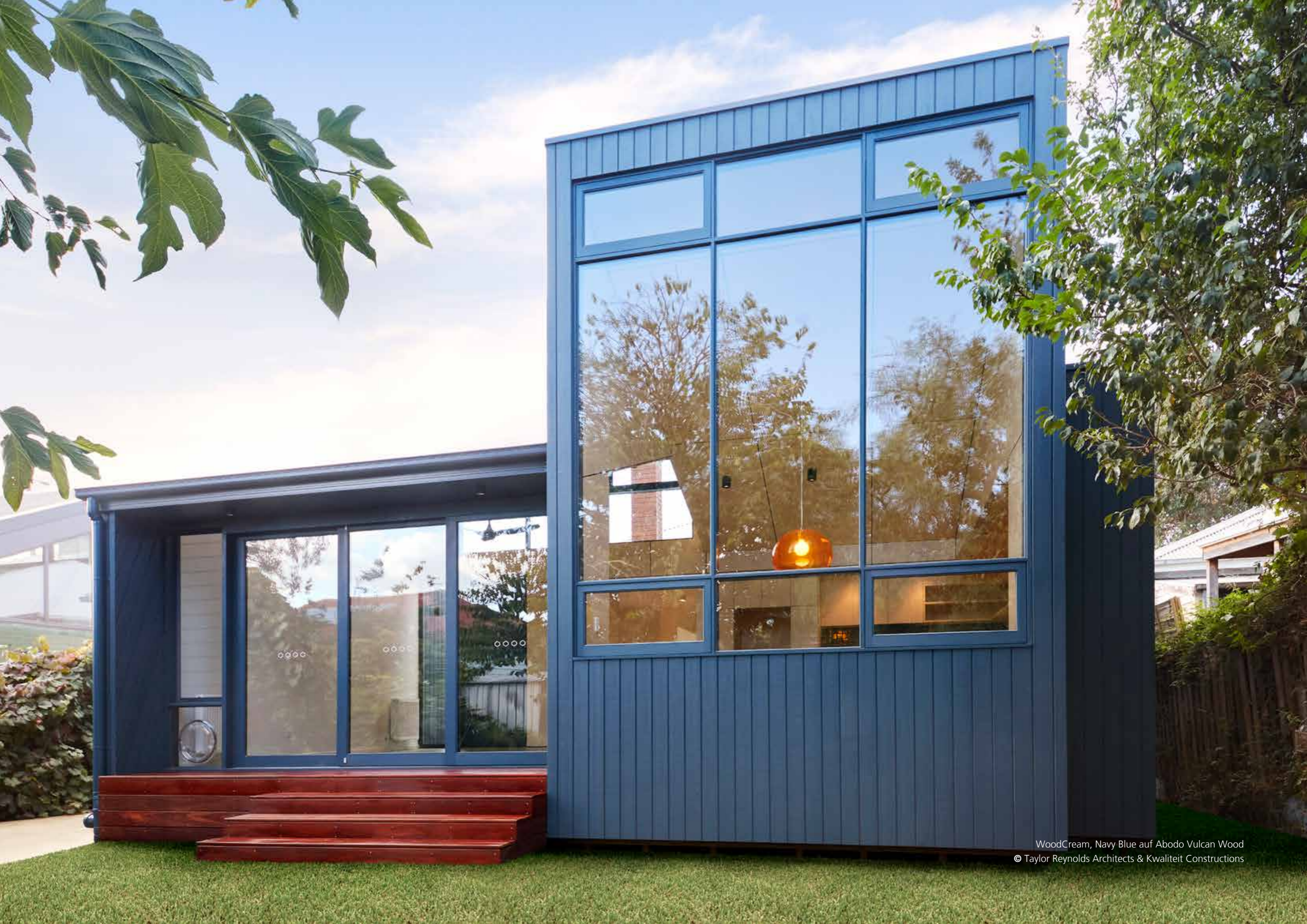
WoodCream, Navy Blue auf Abodo Vulcan Wood © Taylor Reynolds Architects & Kwaliteit Constructions