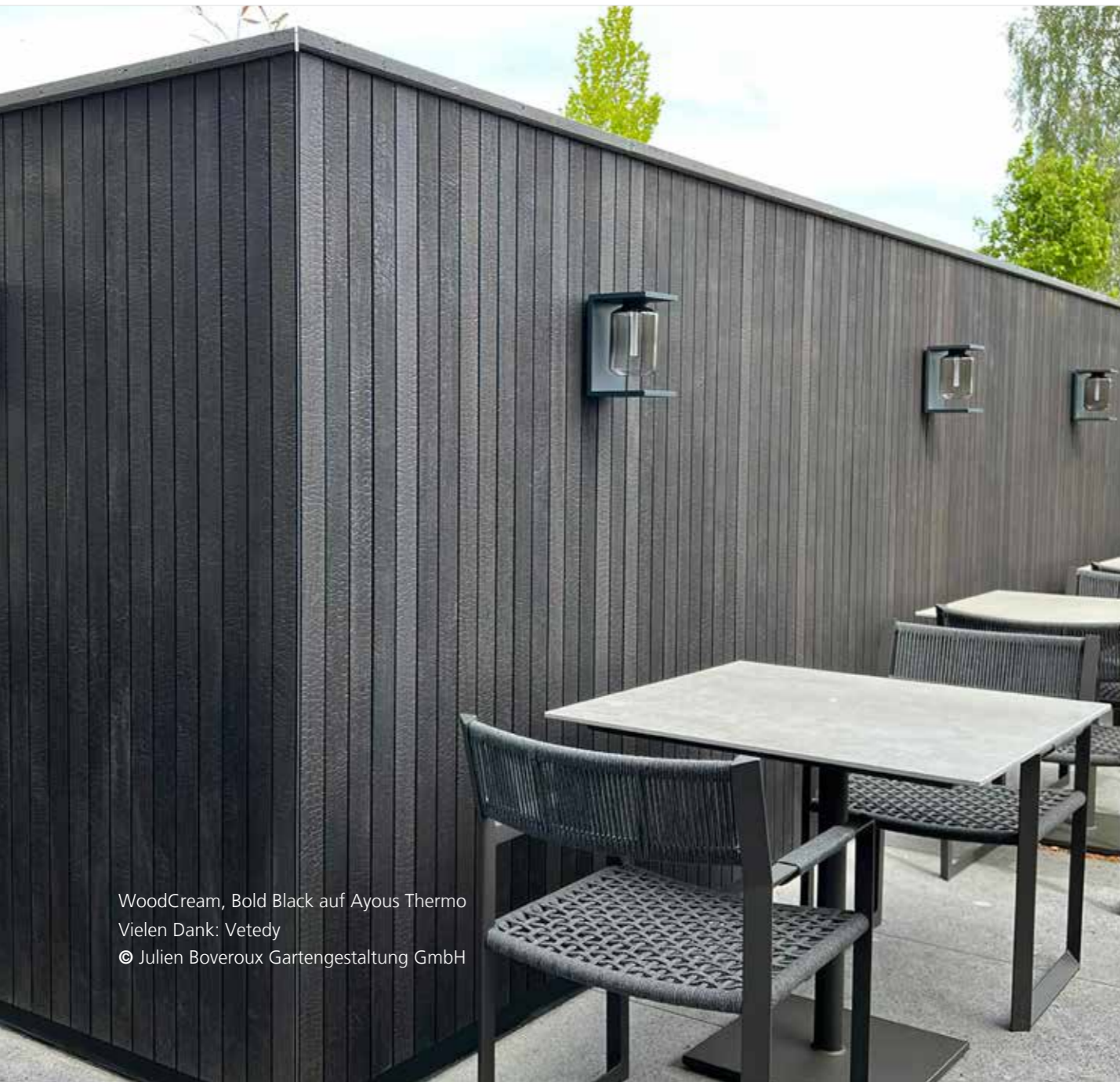
WoodCream, Bold Black auf Ayous Thermo Vielen Dank: Vetedy © Julien Boveroux Gartengestaltung GmbH

Im Außenbereich ist die Behandlung von Holzoberflächen mit dem richtigen Produkt unerlässlich. Die Schönheit des Holzes soll schließlich für lange Zeit erhalten bleiben. WoodCream ist das ideale Produkt, um Ihre vertikalen Holzoberflächen im Außenbereich zu schützen und zu färben. Das Produkt eignet sich sowohl für neues als auch für behandeltes Holz. Neben dem optimalen Schutz erhält die Creme auch die natürliche Optik und Haptik des Holzes.