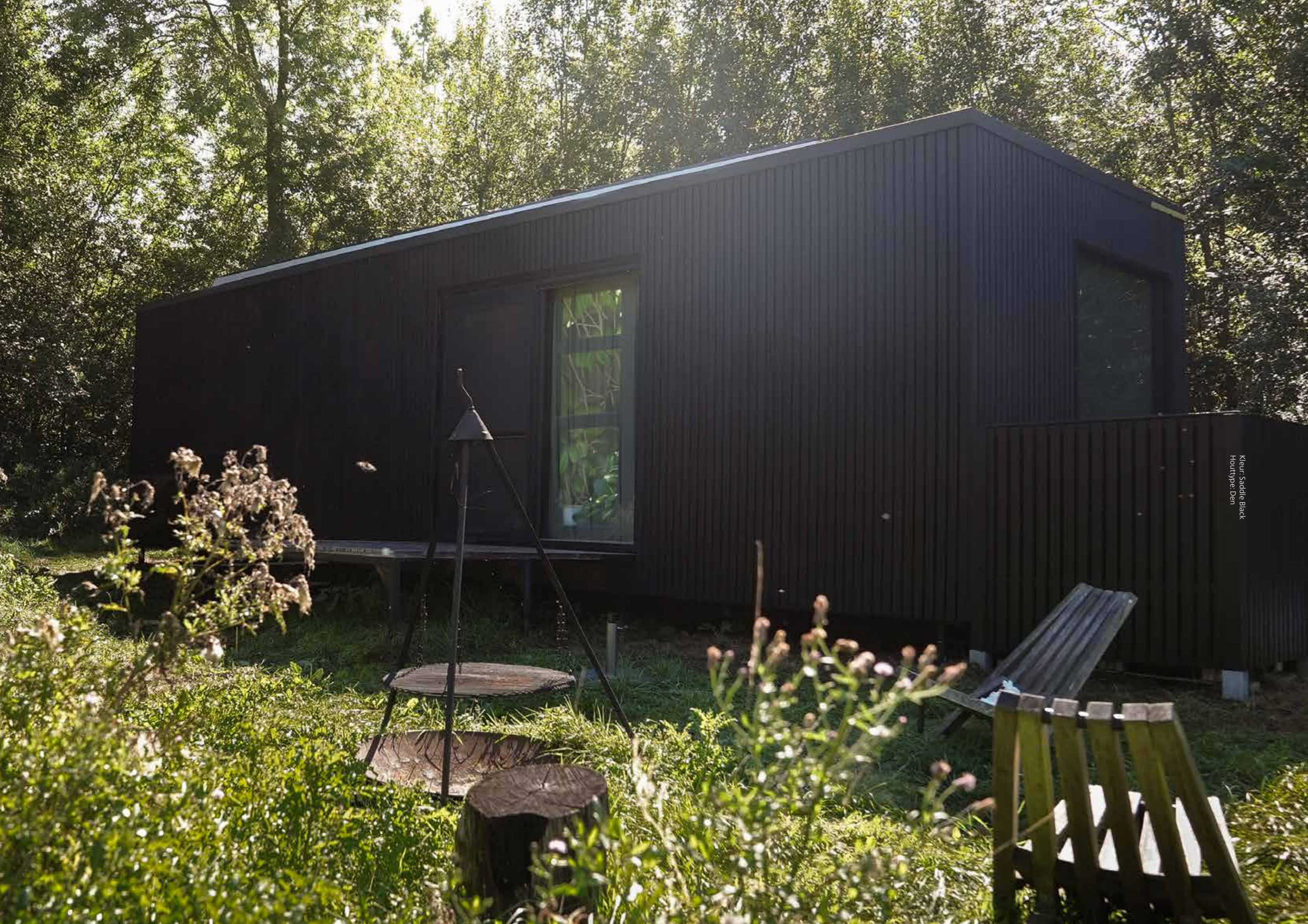
Kleur: Saddle Black Houttype: Den