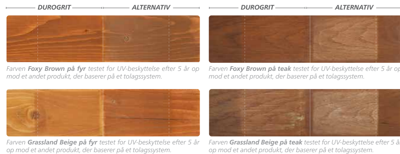
Farven Foxy Brown på fyr testet for UV-beskyttelse efter 5 år op mod et andet produkt, der baserer på et tolagssystem.

Vi siger ikke bare, at vores UV-beskyttelse er den bedste på markedet - vi kan også dokumentere det. Træprøverne nedenfor er resultater af omfattende QUV-tests i vores laboratorium jf. standarden EN 927-6. En QUV-test er en accelereret vejrpåvirkningstest , som hurtigt simulerer skader forårsaget af sollys, regn og dug. Sådan kan vi inden for blot få uger genskabe de skader, som de vil se ud efter flere års vejrpåvirkning.