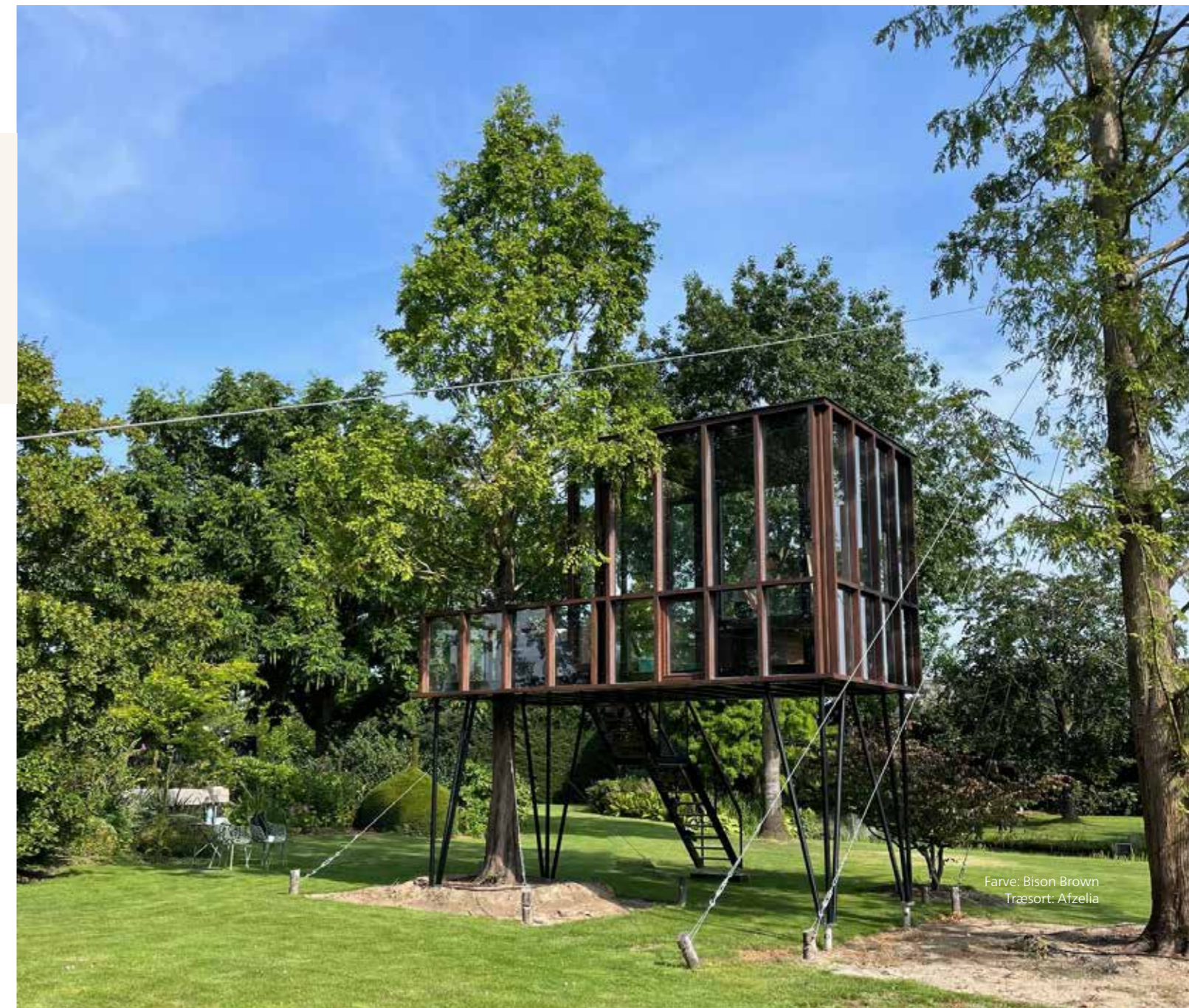
Farve: Bison Brown Træsart: Afzelia