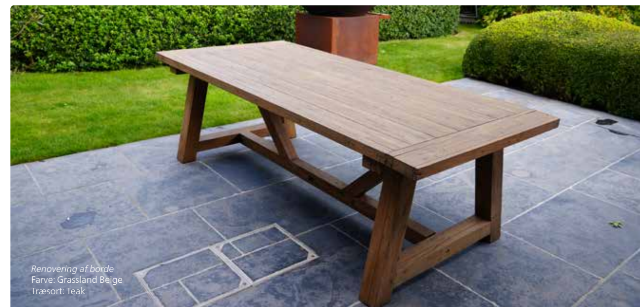
Renovering af borde Farve: Grassland Beige Træsart: Teak

Resultaterne viser klart, at DuroGrit farverne holder bedre end farverne i det andet produkt.