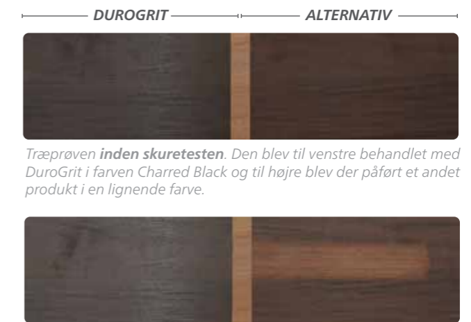
Træprøven inden skuretesten . Den blev til venstre behandlet med DuroGrit i farven Charred Black og til højre blev der påført et andet produkt i en lignende farve.

Venstre halvdel af træpladerne blev behandlet med DuroGrit, og højre halvdel med et andet produkt. En del af pladen blev placeret under en lille børste, som bevægede sig frem og tilbage 600 gange. Derved slides beskyttelsen af og man ser, hvor mekanisk bestandig DuroGrit er i forhold til andre produkter på markedet. Det ses tydeligt, at DuroGrit tilbyder fremragende mekanisk bestandighed.