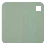
SALT LAKE GREEN