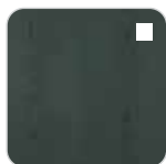
RUBIO MONOCOAT GREEN