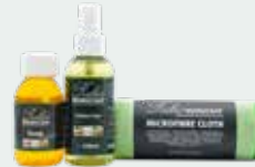
Clean Set - Floors & Stairs