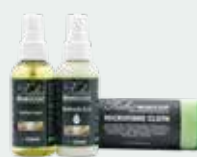
Clean Set - Furniture