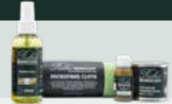
Care Set - Furniture & Stairs

ALSO AVAILABLE FOR FURNITURE, STAIRS & FLOORS: