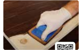
Oil Plus 2C