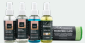
Stain Removal Set - Floors, Furniture & Stairs